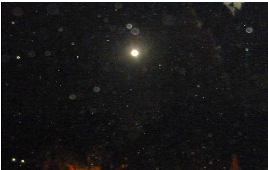
Nuit de pleine lune dans le ciel de Bodhgaya en Inde - 2007