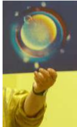
La cellule souche

La cellule se divise en deux, en quatre, en huit, en seize, en trente-deux, en soixante quatre (tandis qu'une cellule cancéreuse se multiplie). Cette division est à l'origine des 60 premiers points d'acupuncture et de l'étape de la morula. Les cellules vont se diviser puis les organes vont se former par la concentration des molécules d'énergie au point de rencontre des courants.