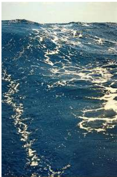
Traversée de l'océan Atlantique