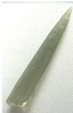
Quartz vert du Fleuve Jaune

Les larmes, la sueur, le liquide amniotique... les eaux du corps humain sont salées comme l'océan.