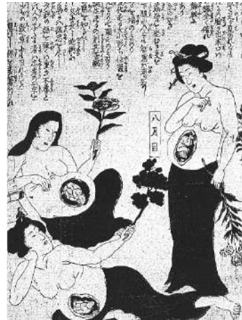
Femmes enceintes et arbres de vie

Durant neuf mois, l'utérus se transforme en grotte, en précieux refuge. La lumière de l'embryon. La matière du fœtus. Les forces fondamentales qui ont permis la création de l'univers fondent aussi les lois d'équilibre de la cellule et de la division cellulaire. L'astrophysique, l'embryologie et la Bible racontent ces étapes. L'astrologie aussi qui peut dresser notre carte du ciel, nos signes distinctifs et constellations.