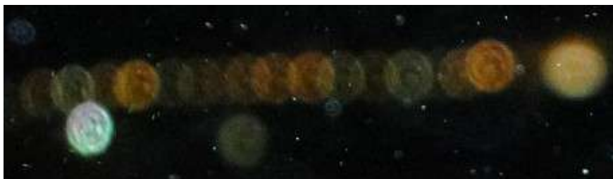
Nuit de printemps dans le ciel de Biarritz en France - 2010

L'âme choisit sa mère. L'âme choisit son père. Trois mois avant l'acte de la conception, elle va tourner autour de sa future maman, attirée par la longueur d'onde de son utérus (l'ut-terre-us - l'ut de la note do – la terre où prendre racine – us comme le nous en anglais). Ainsi, le bébé qui vient au monde a déjà un an !