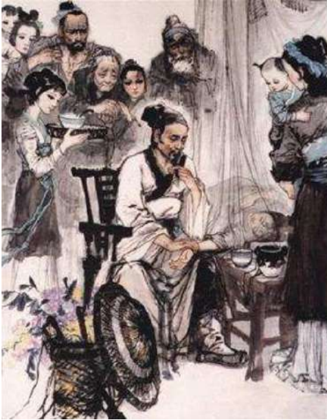
Acupuncteur à l'écoute des pulsations

« Le placenta est la boîte à rythme du battement à deux temps. Il donne au sang sa rythmicité. La musique est la discipline la plus proche du placenta. »