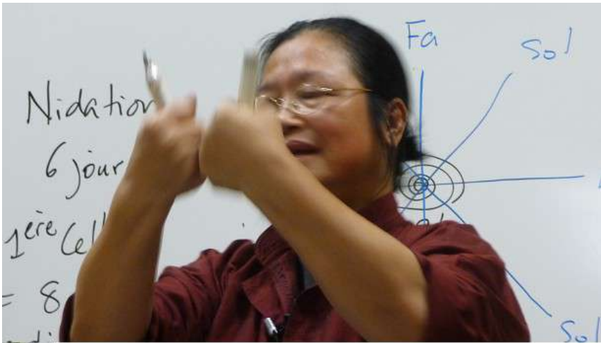
La première division cellulaire

Il existe « un fil d'or » entre l'ovule et le spermatozoïde. Ce fil, à la fois corde de lumière et onde vibratoire, est le premier des 8 Vaisseaux Merveilleux. Il se nomme 任脉 , Rèn Mài ou Vaisseau Conception. Il tisse un lien entre le spermatozoïde et l'ovule, il participe à la fusion de leur noyau, une fusion qui va dégager de la chaleur et l'énergie suffisante pour orchestrer la division.